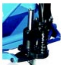
Bomba hidráulica compacta e hermética