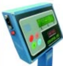
Disponível também com sistema de balança