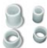
Operação silenciosa com buchas em nylon auto-lubrificado