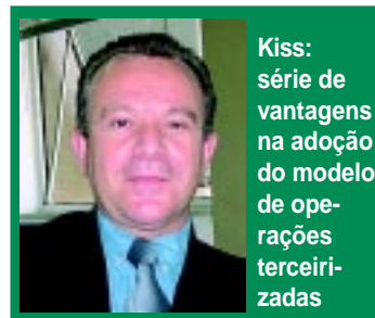
Kiss: série de vantagens na adoção do modelo de operações terceirizadas

“A logística é vital para qualquer empresa. A escolha equivocada de um prestador de serviços