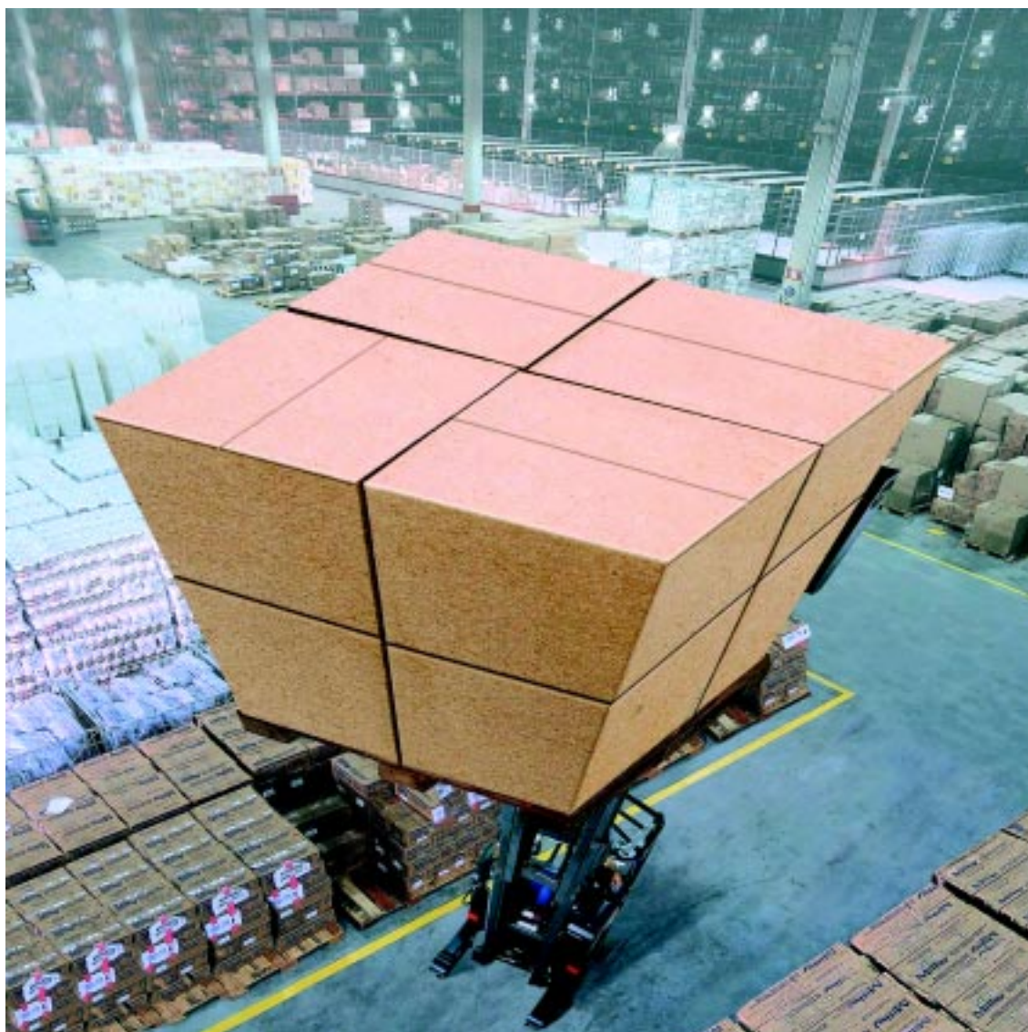
Terceirização: também melhor qualidade nas operações logísticas