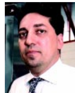
Waldmann: "todo o cuidado deve ser tomado na escolha do aparelho a ser utilizado"

A o analisarmos o valor do investimento com carregadores de baterias frente às baterias e máquinas, teremos um número com menor representatividade no conjunto. Entretanto, com uma análise mais criteriosa, facilmente constataremos que o número não reflete a importância do equipamento no desenvolvimento do trabalho e na preservação, principalmente, da bateria, cujo valor representa até três