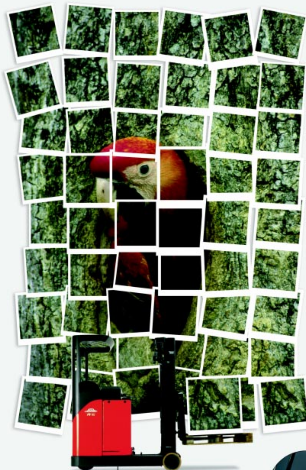
R16 Empilhadeiras Elétricas Retráteis. Capacidade: 1,6 ton.