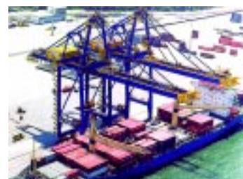
Terminal está sendo informatizado

As soluções possibilitam a atualização online dos estoques e maior precisão dos inventários. E permitirão, também, a integração com o sistema de operacionalização de