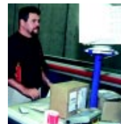
Sistema permite total interação

De acordo com ele, o diferencial do sistema é que os funcionários da empresa, agentes de distribuição e clientes podem operar diretamente pelo banco de dados disponível no site da Total Express, bastando que