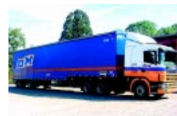
Frota garante menor custo

A pós investir R$ 7,5 milhões no início do ano na compra de 30 cavalos-mecânicos Scania R124 com semi-reboque sider no modelo rebaixado, a Transportadora DM, sediada em Eldorado do Sul, RS, acaba de encomendar outros 30 cavalos-mecânicos, com investimento de R$ 9 milhões. A entrega da nova frota, que também terá semi-reboque do tipo sider, porém do modelo plano, está prevista para setembro. Estes novos semi-reboques têm 15,2 m de comprimento, 2,5 m de largura e 2,62 m de altura interna, e são indicados para o transporte de mercadorias paletizadas.