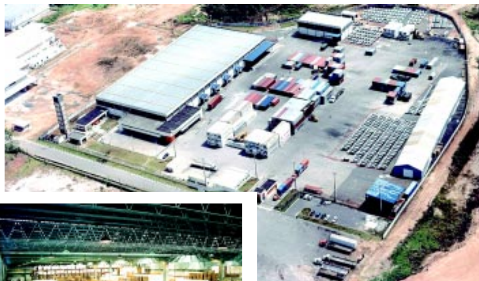
EADI Salvador: segurança na operação de exportação

Com a publicação, no Diário Oficial da União, do Ato Declaratório Executivo SRRF/5ªRF nº 16, de 28/07/2003, o Consórcio EADI Salvador Logística e Distribuição, da Columbia, torna-se o primeiro recinto alfandegado da Bahia a ter autorização para operar em regime especial de Depósito Alfandegado Certificado.