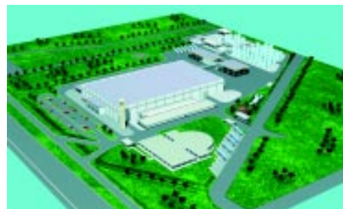
Novo CD deve aumentar a produtividades em 50%

O novo CD foi elaborado para atender às necessidades específi-