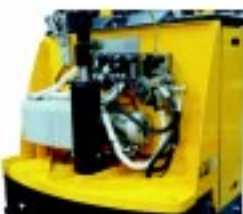
Tecnologia Mundial com suporte e garantia Paletrans.