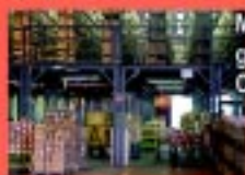
Mezanino com pisos metálicos, grelha ou madeira revestida. Capacidade até 1000 kg/m²