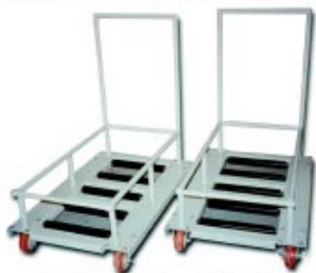
Carrinhos para troca de bateria

Design moderno e tecnologia 100% nacional