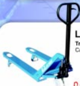
LINHA PL Transpaletes Capacidade: 2000/3000 kg

*Preço do equipamento sem bateria e carregador - IPT de 5% a ser acrescido no preço.