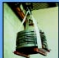
Fitas para elevação e movimentação de cargas