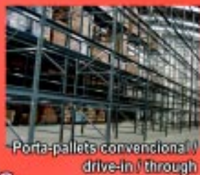
Porta-pallets convencional / drive-in / through

No seu próximo projeto, consulte nossos profissionais.