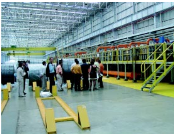
Visita às instalações da Esmena agradou a todos

Segundo Miranda, os resultados foram bem satisfatórios quanto aos contatos realizados no evento, e ele se surpreendeu positivamente com o número de participantes. "Isto nos anima cada vez mais a participar, considerando que fomos um dos que acreditaram desde o primeiro evento e sabemos da sua importância no setor de logística no Brasil. Temos que investir mais neste tipo de evento, possibilitando a troca de conhecimentos entre clientes e permitindo