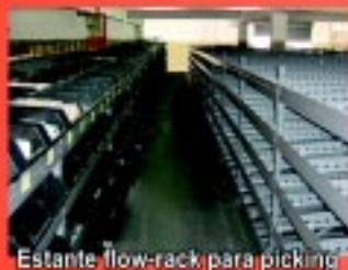
Estante flow-rack para picking

Estamos conquistando um mercado que exige qualidade, precisão e preço justo.