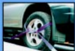
Fitas e cetracas para amarração de automóveis em plataformas