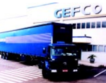
Gefco, parceiro também na Europa

A Gefco, empresa de logística do Grupo Peugeot-Citroën, acaba de firmar uma parceria com a L'Oreal para realizar operações logísticas no Brasil e no exterior para a fabricação de cosméticos francesa.