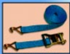
Fitas e cetracas para amarração em geral