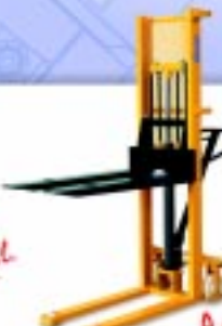
LINHA LM Empilhadeiras Manuais Capacidade: 500/1000 kg Elevação: 1000/1600 mm