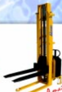
LINHA LE Empilhadeiras Elétricas Capacidade: 1000 kg Elevação: 1600-3400 mm