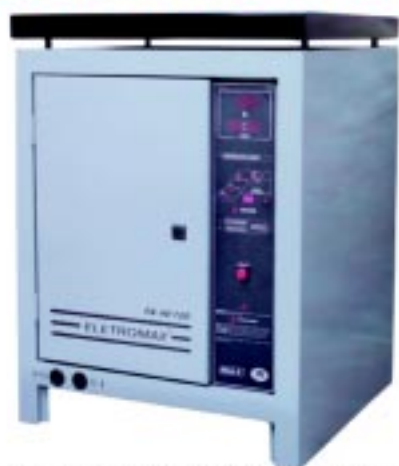
Carregador Série 6 Microprocessado Carregador Série 6 com agito de Eletrólitos