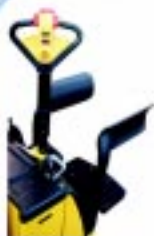
Opcional plataforma para operador a bordo