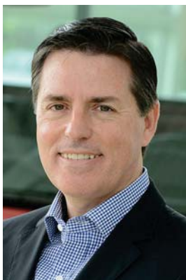
Schaal: "alguns setores da economia dão sinais positivos de aquecimento, como o e-commerce, com expectativa de aumento de 13% neste ano"

A o mesmo tempo em que completa 20 anos da linha Sprinter no mercado brasileiro, com 125.000 unidades vendidas no país, a Mercedes-Benz (Fone: 0800 9709090) estima, para 2017, um crescimento entre 5% e 10% no mercado total de "Large Vans" (3,5 a 5 toneladas de PBT), categoria inaugurada pela Sprinter no Brasil em 1997, com a comercialização de chassis com cabina, furgões e vans.