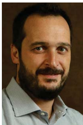
Pelizon, da Rakuten: “para o lojista, o principal desafio quanto à logística é conseguir parceiros eficientes e de fácil integração com as plataformas”

Por sua vez, a HOPE, pioneira no e-commerce de moda íntima no Brasil, desenvolveu totalmente seu novo projeto B2B em parceria com a Rakuten, da qual é cliente desde 2010. O canal B2B da marca já dobrou de tamanho várias vezes e o sucesso foi tanto que resolveu estender a parceria para todos os canais da empresa. Com a plataforma, a HOPE melhorou