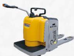
Empilhadeira elétrica retrátil 2,0t